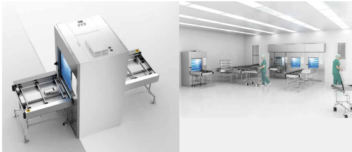
独立装载台和卸载台

即使在狭窄拥挤的安装环境中，Getinge 全新的旋转台也可为装载留出足够的空间，便于操作。全新的自动化系统非常灵活，使清洗消毒器的摆放位置也变得更灵活，可将清洗消毒器放在靠近墙壁、柱子及其它具有挑战性的地方。对于扩展现有设施，过去是个难题，但现在可轻易解决。