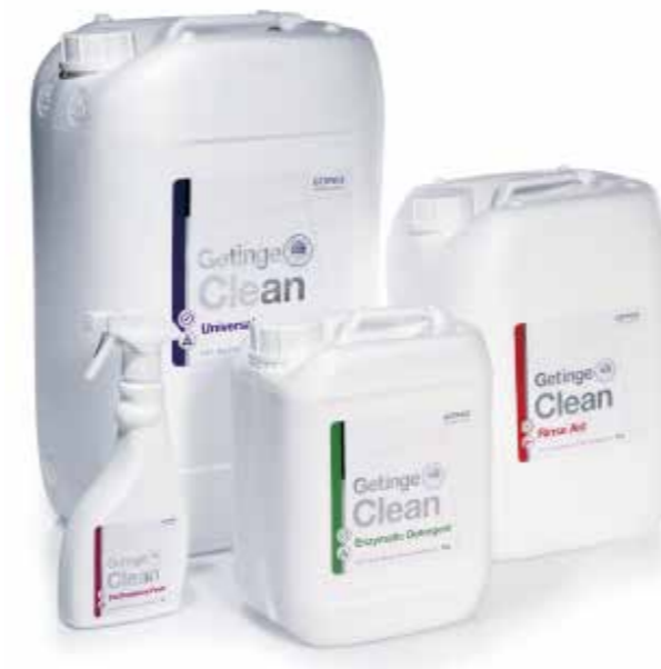
Getinge CLEAN 清洗剂系列

我们提供多种多样的附件，适用于不同类型的物品和容量需求，包括各类清洗架。如需查看所有可选件，请参考 86 系列清洗消毒器的装载设备手册。