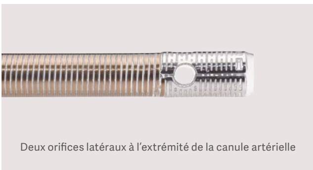
Deux orifices latéraux à l'extrémité de la canule artérielle

Leurs performances de débit, le large choix de tailles de canules et les différentes options de revêtement les font figurer parmi les canules périphériques les plus utilisées pour l'accès vasculaire pendant la circulation extracorporelle.