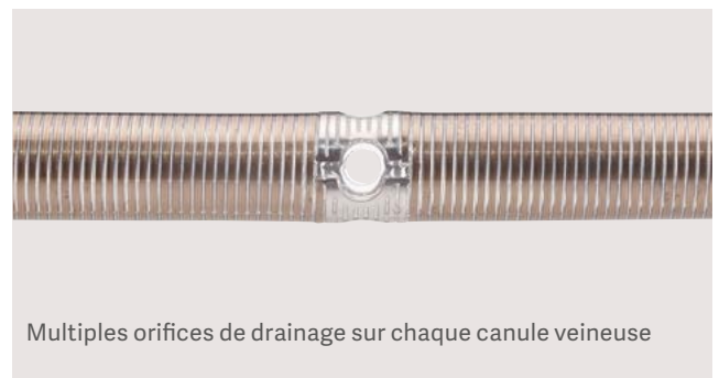
Multiplés orifices de drainage sur chaque canule veineuse