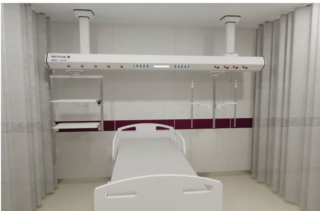
Solution rangement et perfusion

La lumière Somnus a été conçue conformément aux recommandations du Lighting Research Center (Centre de Recherche Eclairage). Les tons bleus simulent la lumière du matin, tandis que les tons rouges représentent la lumière du soir (basés sur le rythme circadien).