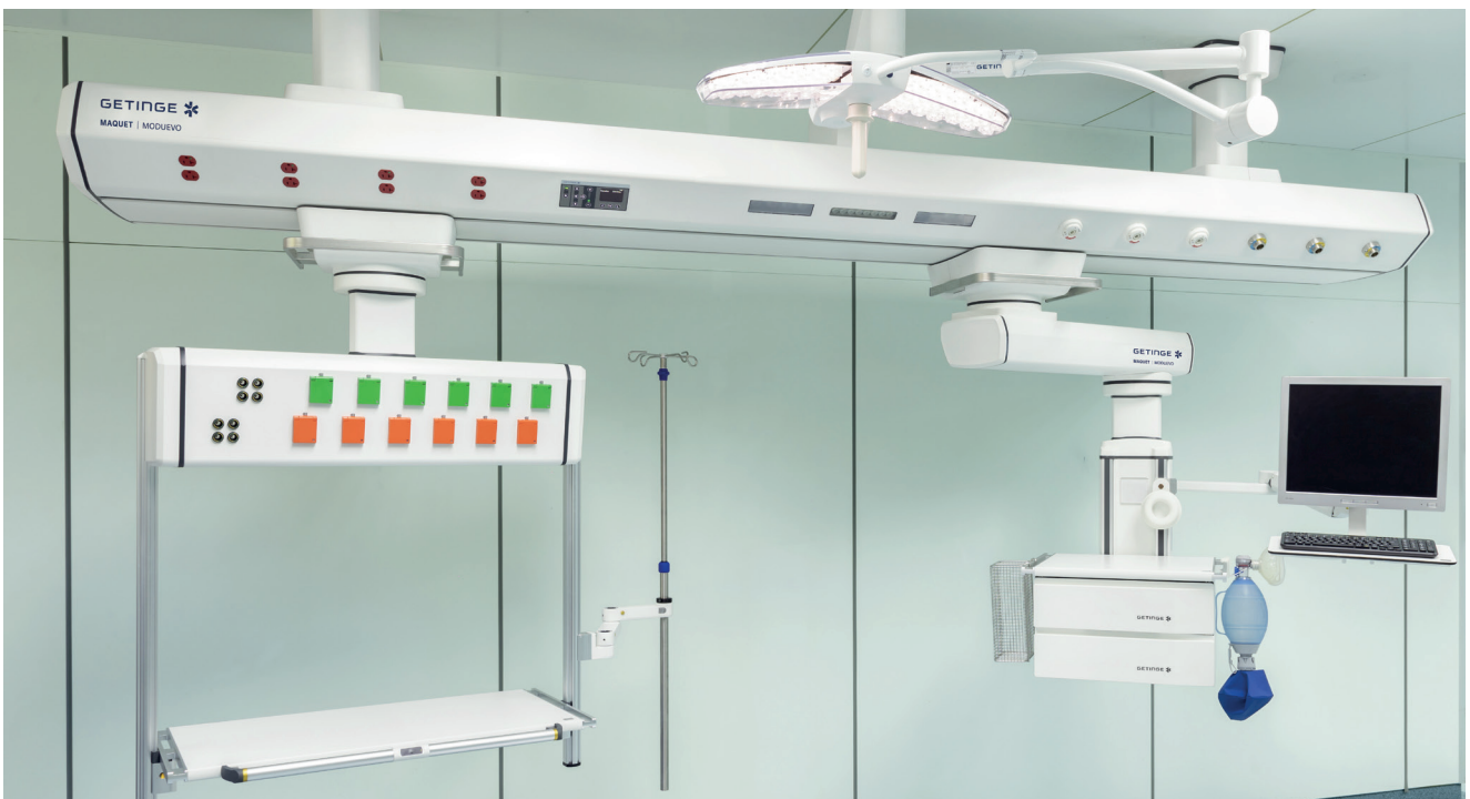
Solution avec le Sky Module.

Getinge a développé une solution horizontale pour s'adapter aux contraintes architecturales : Moduevo Bridge. Ce bras de distribution plafonnier compact et a été conçu dans le but d'améliorer les interactions entre le personnel soignant et le patient indépendamment du niveau d'urgence, en conservant tout le nécessaire à portée de main. Il peut être installé dans les unités de soins intensifs pour des patients très dépendants, ainsi que dans les services de convalescence et aux urgences.