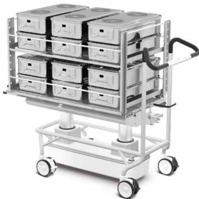
Intelligente AHT-Rollwagen für die Be-/Entladung.

Die innovative, vollständig automatische Lösung von Getinge mit einem einzigen Beladepunkt verbessert den Durchsatz für ZSVAs mit mehreren Sterilisatoren. In dem Moment, in dem ein Sterilisator frei ist, wird er automatisch neu beladen. Dies ermöglicht eine maximale Verfügbarkeit und Auslastung.