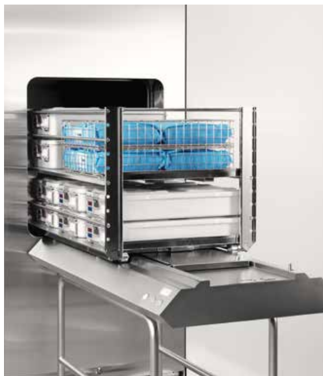
Automatische Be- und Entladeeinheit für Einsatzgestelle (GL64SR).