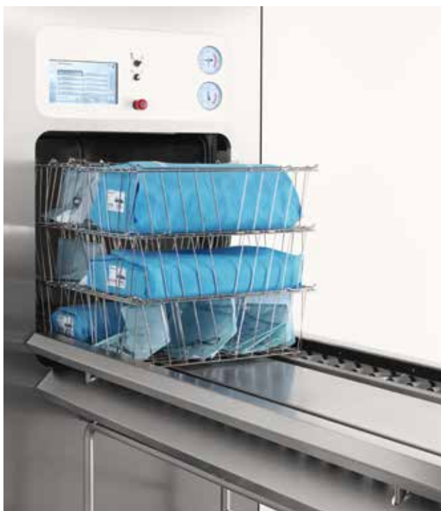
Automatische Be- und Entladeeinheit für Körbe (GL64B).

Wir bieten komplette, effiziente, wirtschaftliche und ergonomische Handlingsysteme für Körbe und Container. Ob automatisch oder manuell: Wir passen jedes Detail individuell an, um die Arbeit für jede ZSVA leichter und effizienter zu machen – egal, ob Sie einen oder zehn Sterilisatoren nutzen!