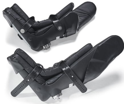
Standard-Beinschalen (schwarz) für Patienten bis 160 kg

Patientenkomfort: Mithilfe der Klingenaufnahme kann das Bein des Patienten näher am Rotationspunkt der Hüfte gelagert werden. Das reduziert die Belastung für Patienten, die einen eingeschränkten Bewegungsradius im Hüftgelenk haben. Die Beinschalen sind standardmäßig mit Seitenflügeln ausgestattet, um die Stabilität des Beins des Patienten zu verbessern und zu verhindern, dass das Bein nach außen wegrutscht.