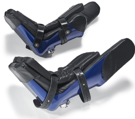
Adipositas-Beinschalen (blau) für Patienten bis 250 kg

Patientenkomfort: Mithilfe der Klingenaufnahme kann das Bein des Patienten näher am Rotationspunkt der Hüfte gelagert werden. Das reduziert die Belastung für Patienten, die einen eingeschränkten Bewegungsradius im Hüftgelenk haben. Die Beinschalen sind standardmäßig mit Seitenflügeln ausgestattet, um die Stabilität des Beins des Patienten zu verbessern und zu verhindern, dass das Bein nach außen wegrutscht.