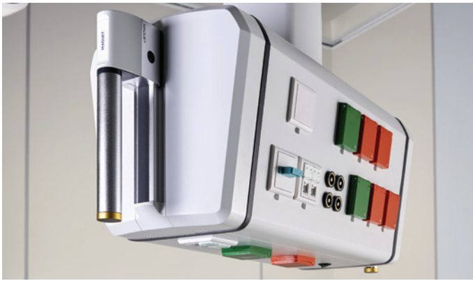
Drei Paneele für Elektro-/Datenanschlüsse und Gasentnahmestellen.