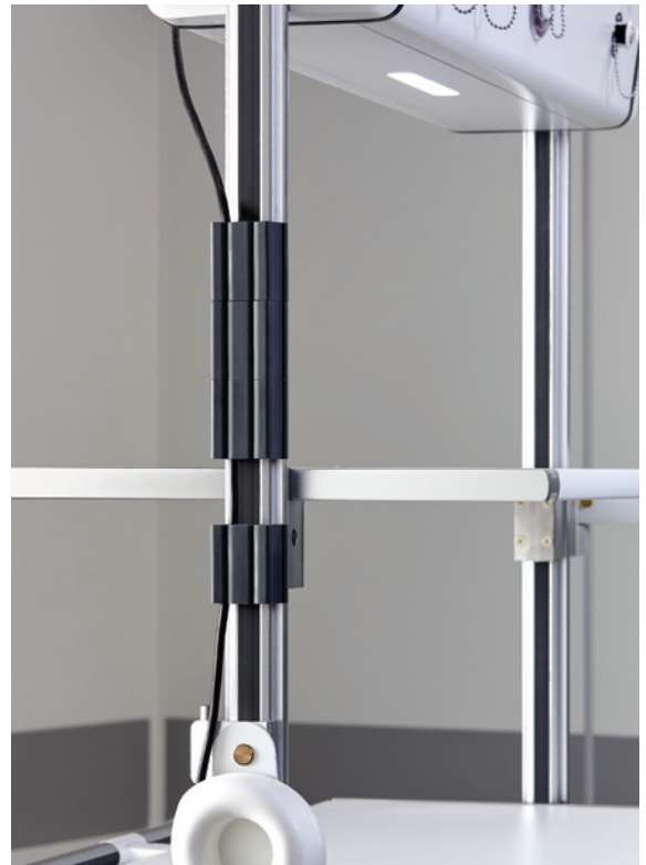
Praktische Lösungen für das Kabelmanagement.